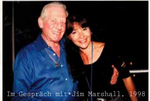
Im Gespräch mit Jim Marshall, 1998

Die SOUND-BOX bot mir die Chance, nicht nur Musiker, sondern auch die Erfinder, Entwickler und Instrumentenbauer der weltweit feinsten Instrumente, Mikrofone, Mischpulte kennen zu lernen und das war und ist mir eine Ehre. Bei Dobro und AKG durfte ich die Fertigung besuchen und fotografieren. Kaum jemand hat Zutritt zu diesen heiligen Hallen.